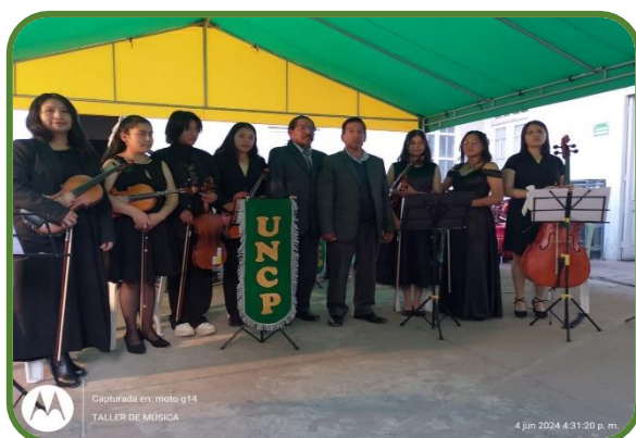
Presentaciones culturales filial central