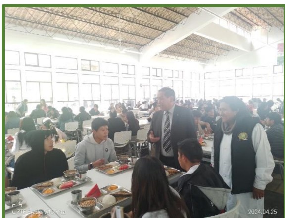
Servicio de Alimentación