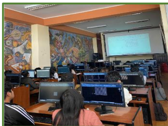
Servicio de biblioteca