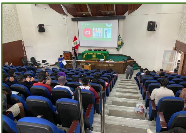
Talleres de formación integral del estudiante