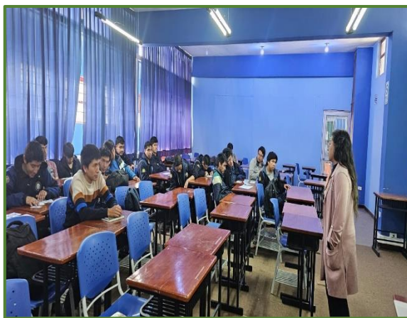
Talleres de formación integral del estudiante

En la tabla 18 muestra el cumplimiento del IND.01.AEI 01.06, durante el primer semestre del 2024, logro un avance del 91.25% equivalente a 2190 atenciones en promedio de los servicios realizadas por las unidades de Servicio de alimentación, Servicio social, Servicio de salud, Servicio de psicopedagogía, Servicio de biblioteca y Servicio de deporte y recreación.