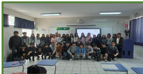
Desarrollo de talleres en selva central y sede central de la UNCP

En la tabla 20 muestra el cumplimiento del IND.01. del AEI 02.02, durante el primer semestre del 2024, no logro desarrollar ningún proyecto, está en desarrollo de implementación, el cual se dará en el mes de julio del 2024.