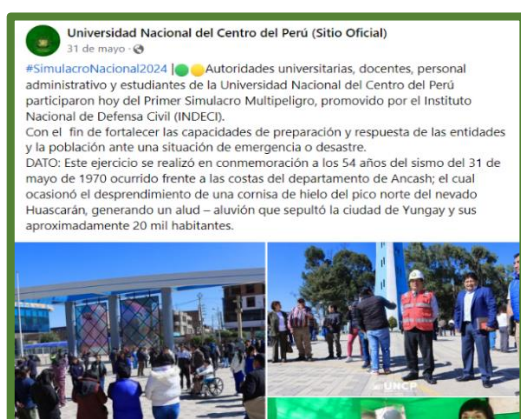
Participación en los simulacros y capacitaciones