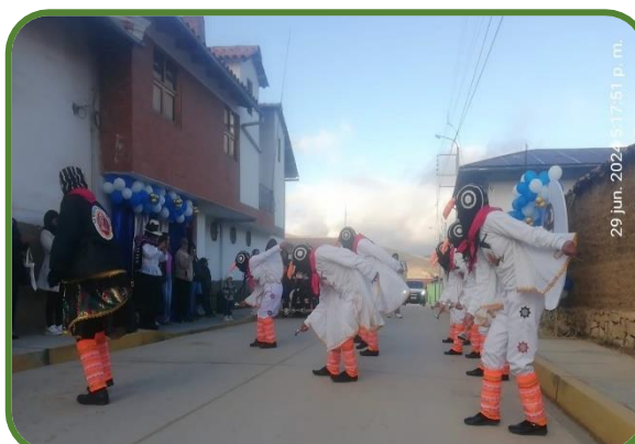
Presentaciones en la Filial Tarma

En la tabla 36 muestra el cumplimiento del IND.01.AEI 03.02, durante el primer semestre del 2024 logro un avance del 100% respecto al logro esperado, con 238 proyectos de proyección social adecuados a los Objetivos de Desarrollo Sostenible 2030. Para la implementación de esta actividad se realizaron la inscripción de 238 proyectos de proyección social para el semestre 2024-I, todas ellas orientadas a los 17 objetivos de desarrollo sostenible que es un plan maestro para conseguir un futuro sostenible para todos, donde se incorporan desafíos globales a los que enfrentamos día a día.