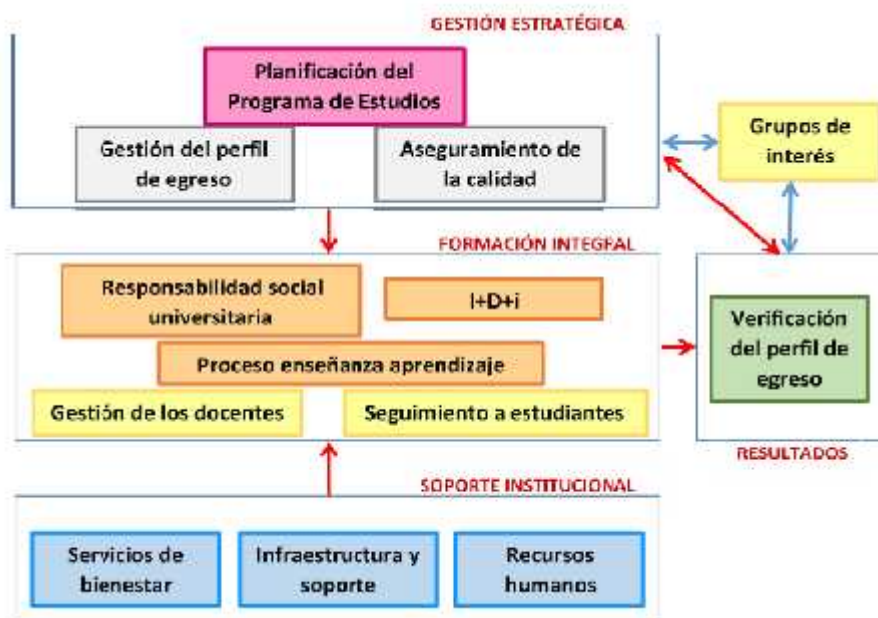
Figura 2. Relación entre dimensiones y factores del Modelo de acreditación de programas de estudio universitarios (Sineace, 2016, p. 15)

Sineace (2016) ha establecido el Modelo de acreditación para programas de estudio universitarios con cuatro dimensiones (gestión estratégica, formación integral, soporte institucional y resultados), con 12 factores, 34 estándares y 55 criterios de evaluación. La UNCP asume este modelo y aplica en la gestión institucional y particularmente en la gestión curricular. Se muestra en la siguiente figura.